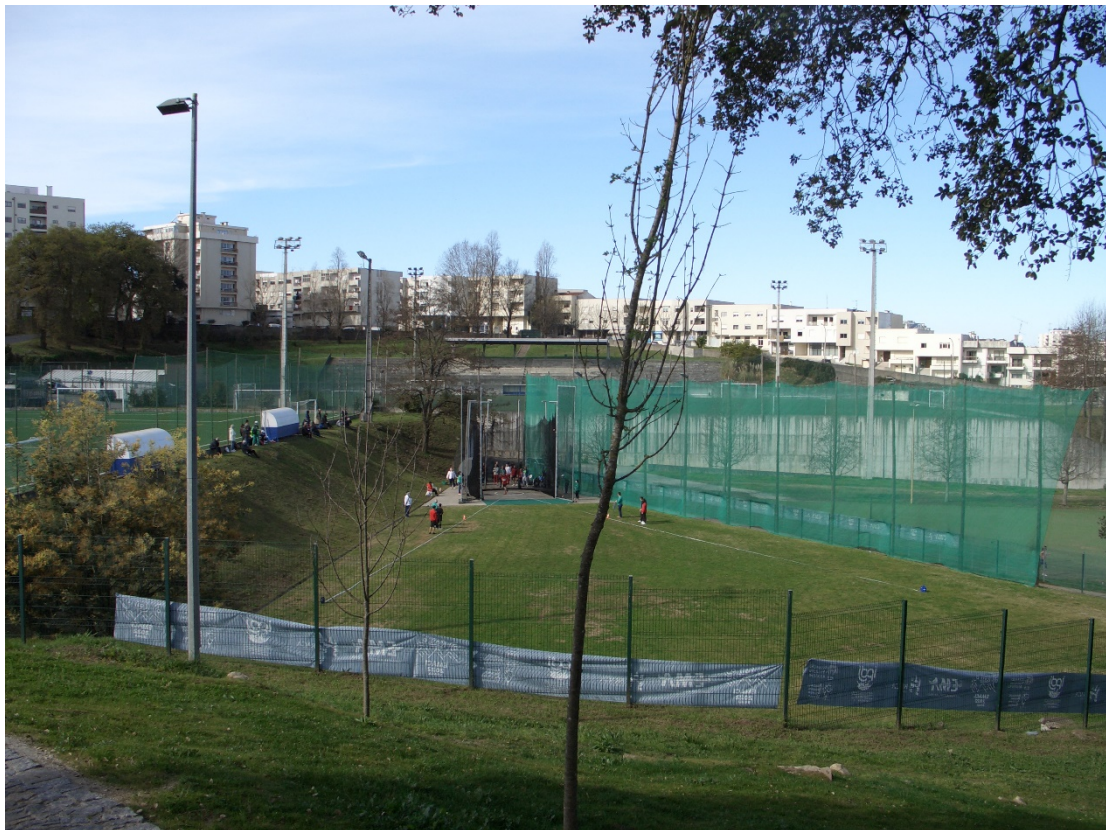
Estadi 1r de Maig (escenari llançaments curts)