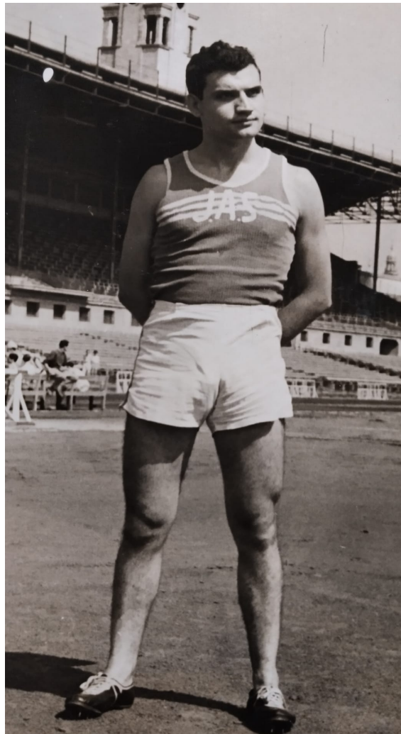
Competició a l'Estadi de Montjuïc (principis dècada anys 50).