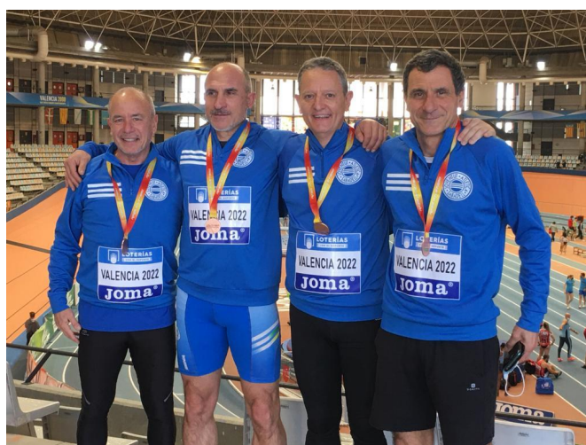
Equip 4x200 M55