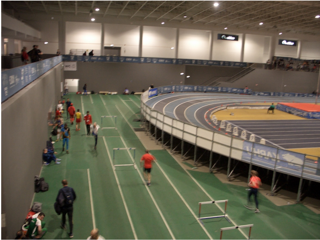
Altice Forum. Zona d'escalfament.