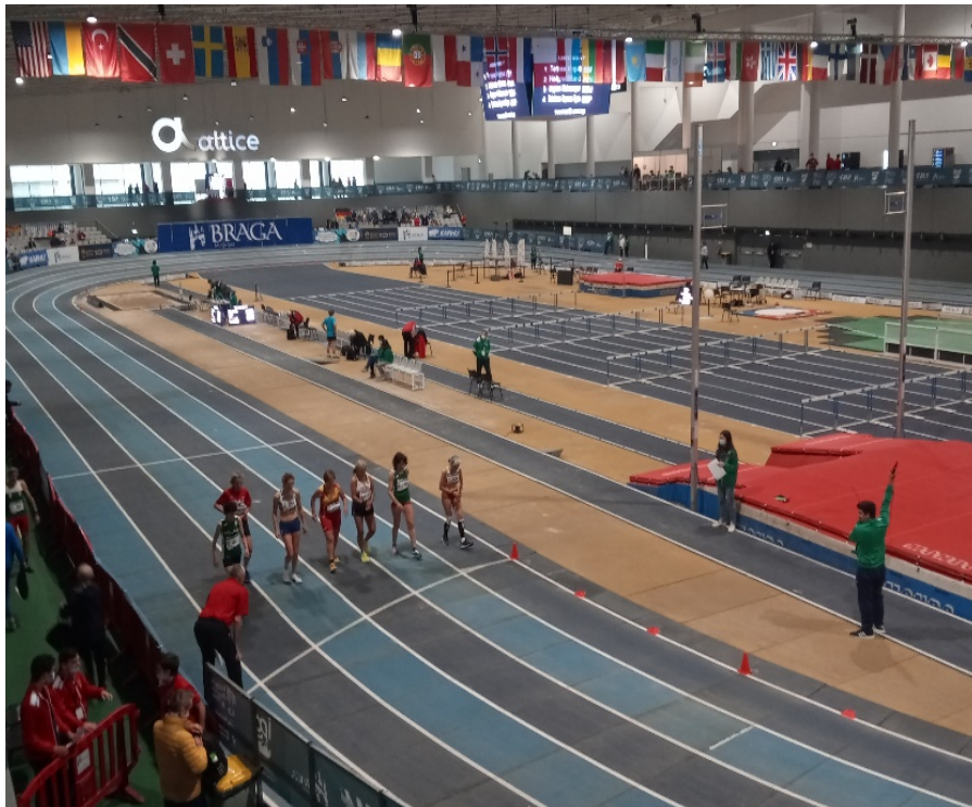
Altice Forum. Sortida 1500 W65