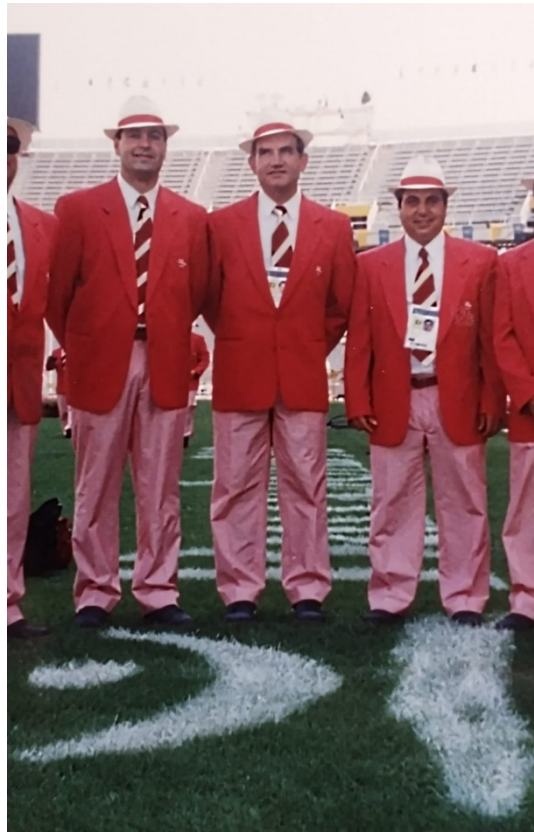
Actuant de jutge als Jocs Olímpics de Barcelona (1992)