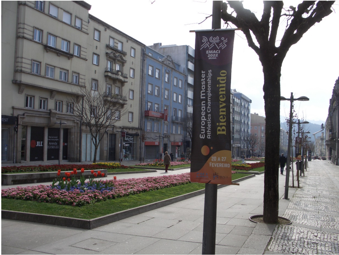
Rètols commemoratius esdeveniment repartits per la ciutat de Braga