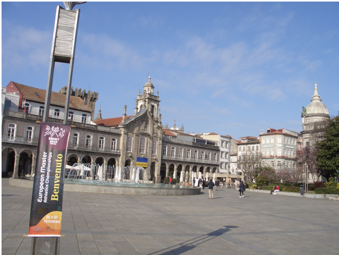
Braga. Centre ciutat