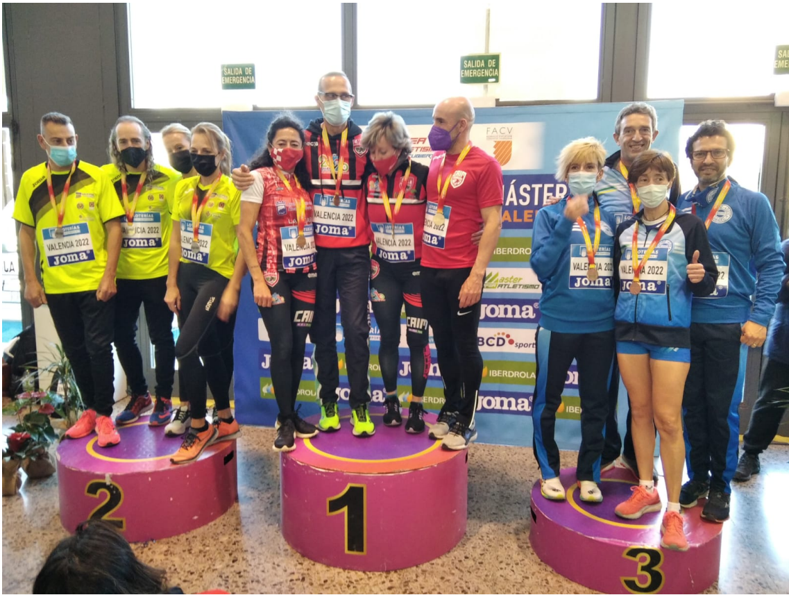
4x200 mitx 50