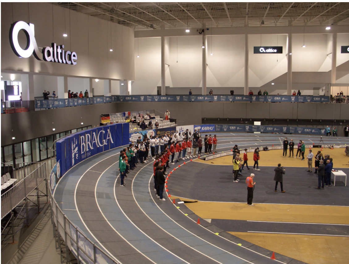
Cerimònia de comiat. Relleu de Braga'22 a Torun'24